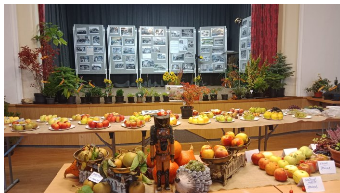
Fotodokumentace z poslední výstavy zahrádkářů včetně i v pozadí na scéně s bannery s cca 60 historickými fotokopíemi dle tematických okruhů z naší obce