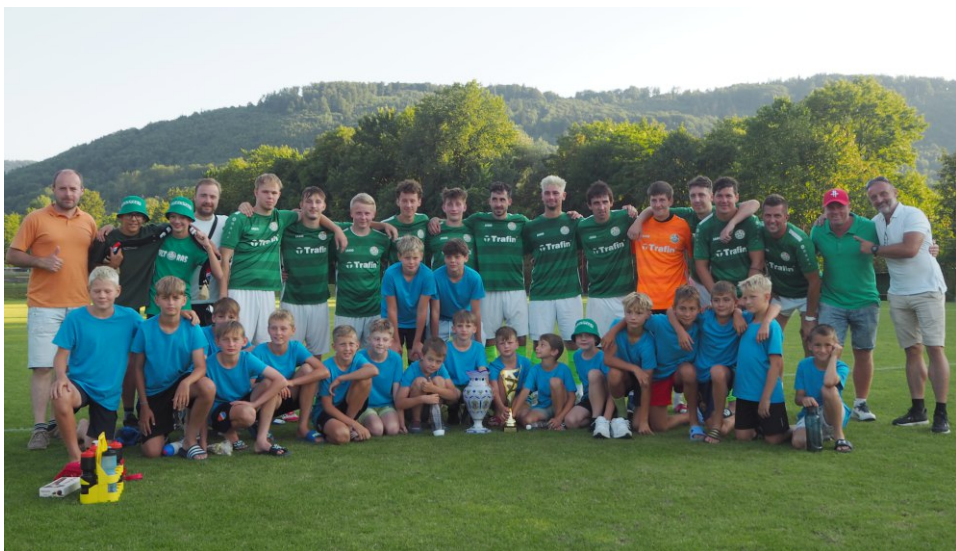
Memoriál Vl. Krejzy 2025

Náš klub se neustále rozrůstá, což je skvělé. I letos k tomu dopomohl Náborový den, na který dorazila řada dětí. Mohly si během tohoto odpoledne vyzkoušet ukázkou tréninku fotbalu a stolního tenisu. Nábor nových členů samozřejmě probíhá celoročně. V případě zájmu se neváhejte ozvat příslušným trenérům. Rovněž se snažíme neustále zlepšovat chod klubu. Od září tohoto roku nám funguje nová klubová platforma, která postupně sdruží všechny členy klubu do jedné aplikace. Jedná se o velký krok vpřed. V návaznosti pak přejdeme i na nové webové stránky, které by měly sloužit